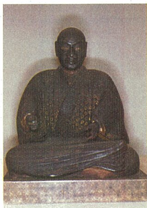
木造 葦名盛氏座像 (国指定重要文化財) 宗英寺蔵