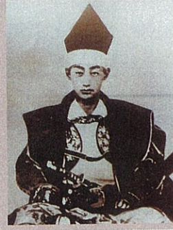
松平容保肖像写真