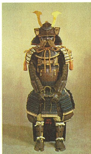
伝 加藤嘉明所用甲冑 個人蔵